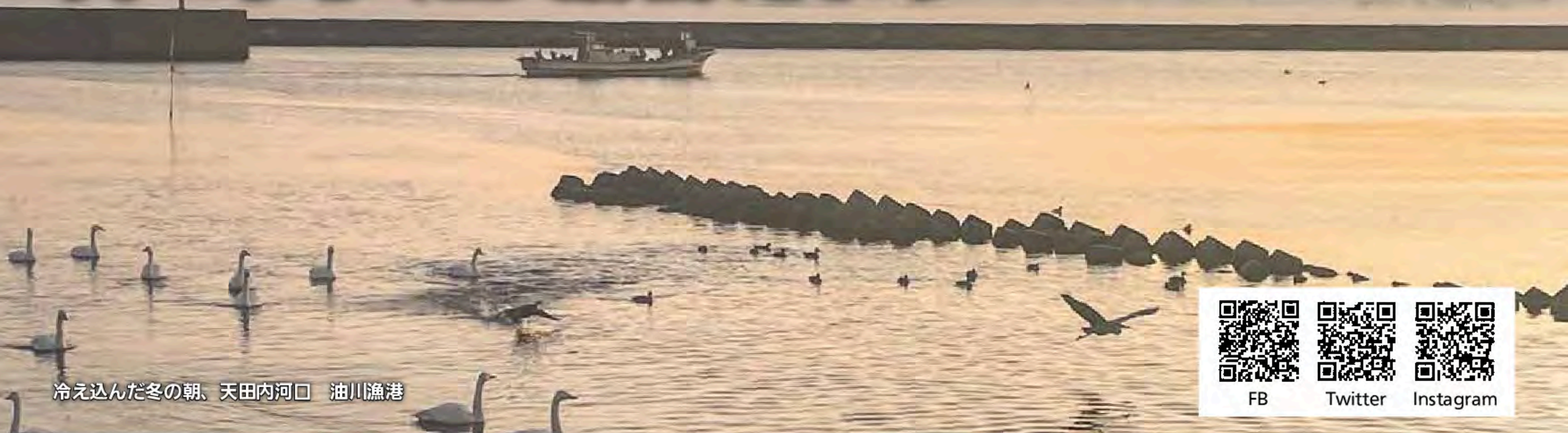
冷え込んだ冬の朝、天田内河口 油川漁港