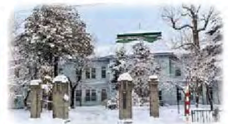
青森市森林博物館